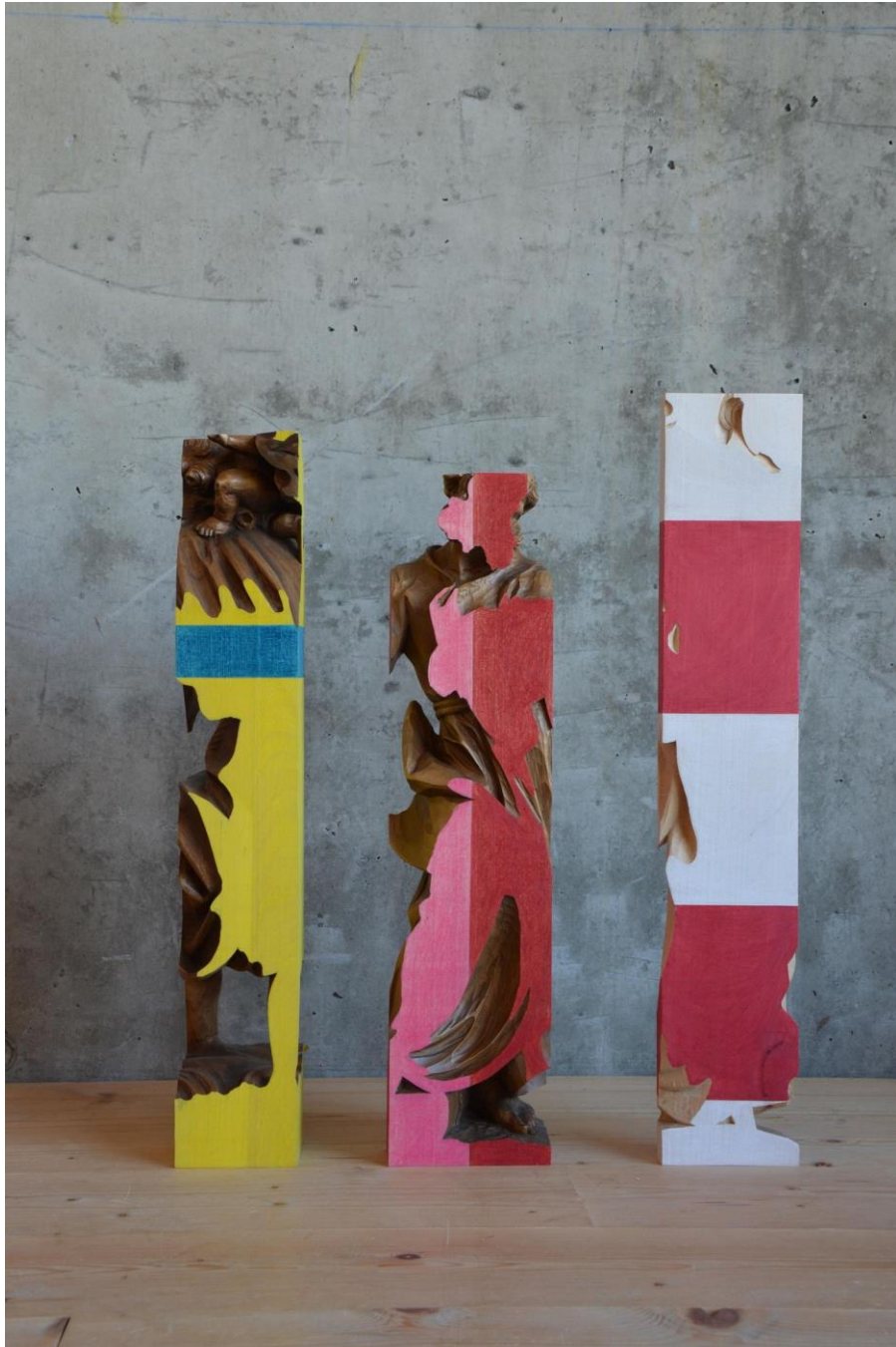
Hubert Kostner "Polychromos" (Holzfiguren)