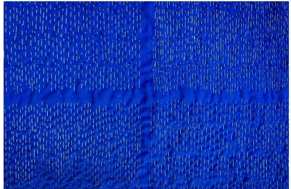
Martina Stuflesser: "Das Kreuz" (Stecknadeln auf blauer Schürze)